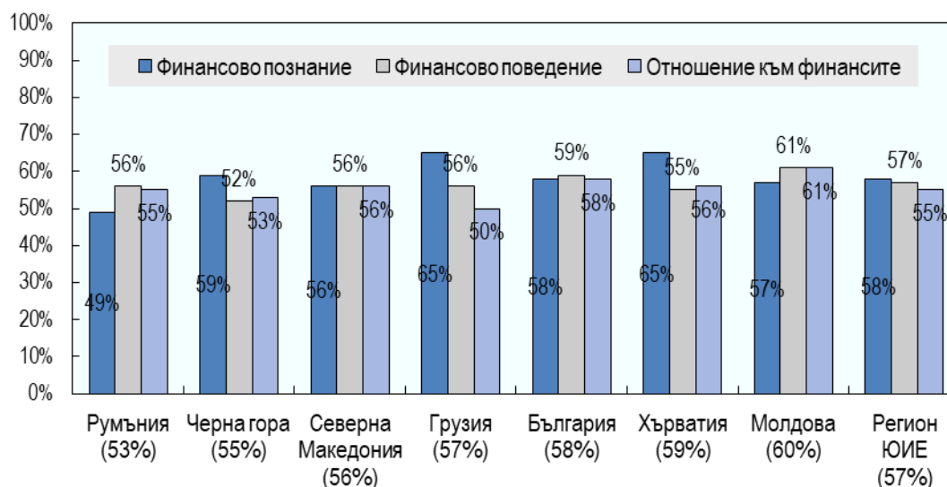
Фигура 1: Елементи на финансовата грамотност за Югоизточна Европа 12